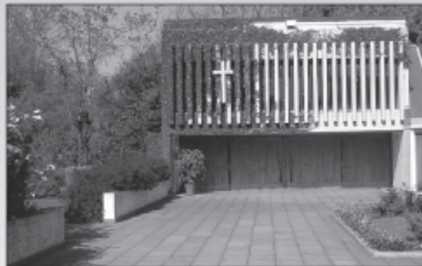
Capilla Pablo Nogués